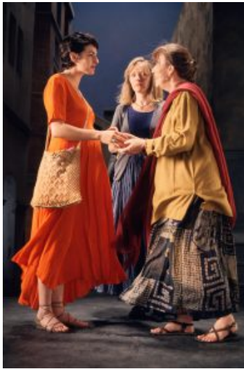
La Salutation (The Greeting) , 1995 Installation audio/vidéo ; 10 min 22 s Performeurs : Angela Black, Suzanne Peters, Bonnie Snyder Courtoisie Bill Viola Studio © Bill Viola Photo : Kira Perov