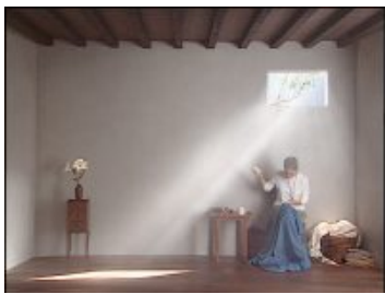
La chambre de Catherine (Catherine's Room) , 2001 Polyptique vidéo couleurs sur cinq écrans plats LCD ; 18 min 39 s Performeur : Weba Garretson Courtoisie Bill Viola Studio © Bill Viola Photo : Kira Perov