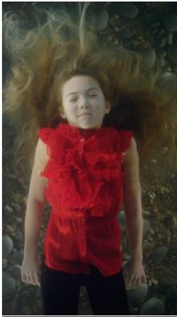
Les rêveurs (The Dreamers) , 2013 (Détail) Installation audio/vidéo ; Vidéo en boucle Performeur : Madison Corn Courtoisie Bill Viola Studio © Bill Viola Photo : Kira Perov