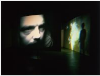
Un récit qui tourne lentement (Slowly Turning Narrative) , 1992 Installation audio/vidéo; Vidéo en boucle Courtoisie Bill Viola Studio © Bill Viola Photo : Gary McKinnis