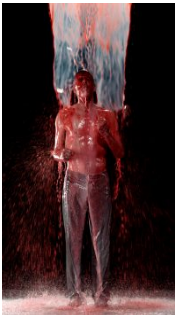
Nacimiento invertido (Inverted Birth) , 2014 Installation audio/vidéo ; 8 min 22 s Performeur : Norman Scott Courtoisie Bill Viola Studio © Bill Viola Photo : Kira Perov