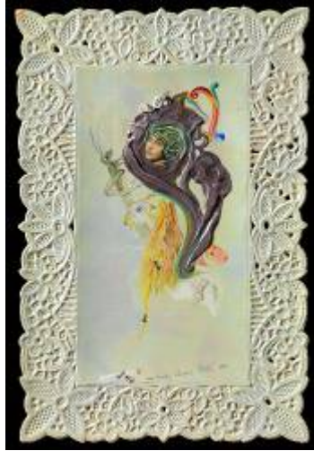
7. Salvador Dalí. Gala , 1931. Fundació Gala-Salvador Dalí, Figueres © Salvador Dalí, Fundació Gala-Salvador Dalí, VEGAP, Barcelona, 2018