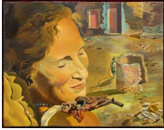
3. 4. Salvador Dalí. Retrat de Gala amb dues costelles de xai en equilibri sobre la seva espatlla . c. 1934. Fundació Gala-Salvador Dalí, Figueres © Salvador Dalí, Fundació Gala-Salvador Dali, VEGAP, Barcelona, 2018

Salvador Dalí. Retrato de Gala con dos costillas de cordero en equilibrio sobre su hombro . C. 1934. Fundació Gala- Salvador Dalí, Figueres © Salvador Dalí, Fundació Gala-Salvador Dali, VEGAP, Barcelona, 2018