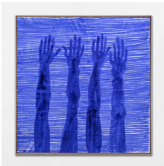
Partage VII , 2020, encre sur toile, 200 x 200 cm.

« L'année 2021 marque le trentième anniversaire de la disparition de l'écrivain poète d'origine africaine (Egypte) Edmond Jabès. Son œuvre n'a pas cessé de nous illuminer. Edmond Jabès, par ce qu'il a su interroger et formuler, est en phase avec ma vision du monde, et son œuvre entre en résonance avec mes pratiques artistiques. Une complicité de pensée s'est avérée à la lecture de ses écrits. L'approche de l'univers d'Edmond Jabès, en particulier son Livre du partage , m'a permis de concevoir une proposition artistique pendant la Biennale internationale de Busan 2020, en Corée ; il en a résulté la série des 8 peintures Partages I - VIII .