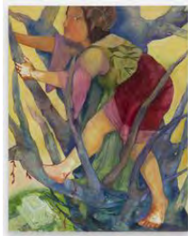
Philemona Williamson A Contemplative Perch, 2017 Huile sur toile / Oil on linen

Téléchargements / Downloads HD / HR BD / LR