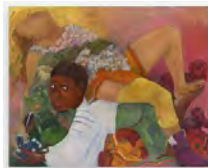
Philemona Williamson Here I Hold Becoming, 2020 Huile sur toile / Oil on canvas

Téléchargements / Downloads HD / HR BD / LR