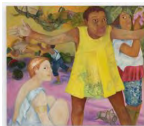
Philemona Williamson A Pause Requested, 2021 Huile sur toile / Oil on canvas

Téléchargements / Downloads HD / HR BD / LR