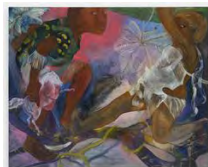
Philemona Williamson Always Climbing, 2016 Huile sur toile / Oil on linen

Téléchargements / Downloads HD / HR BD / LR