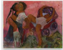
Philemona Williamson Crush on Crush, 2023 Huile sur toile / Oil on canvas

Téléchargements / Downloads HD / HR BD / LR