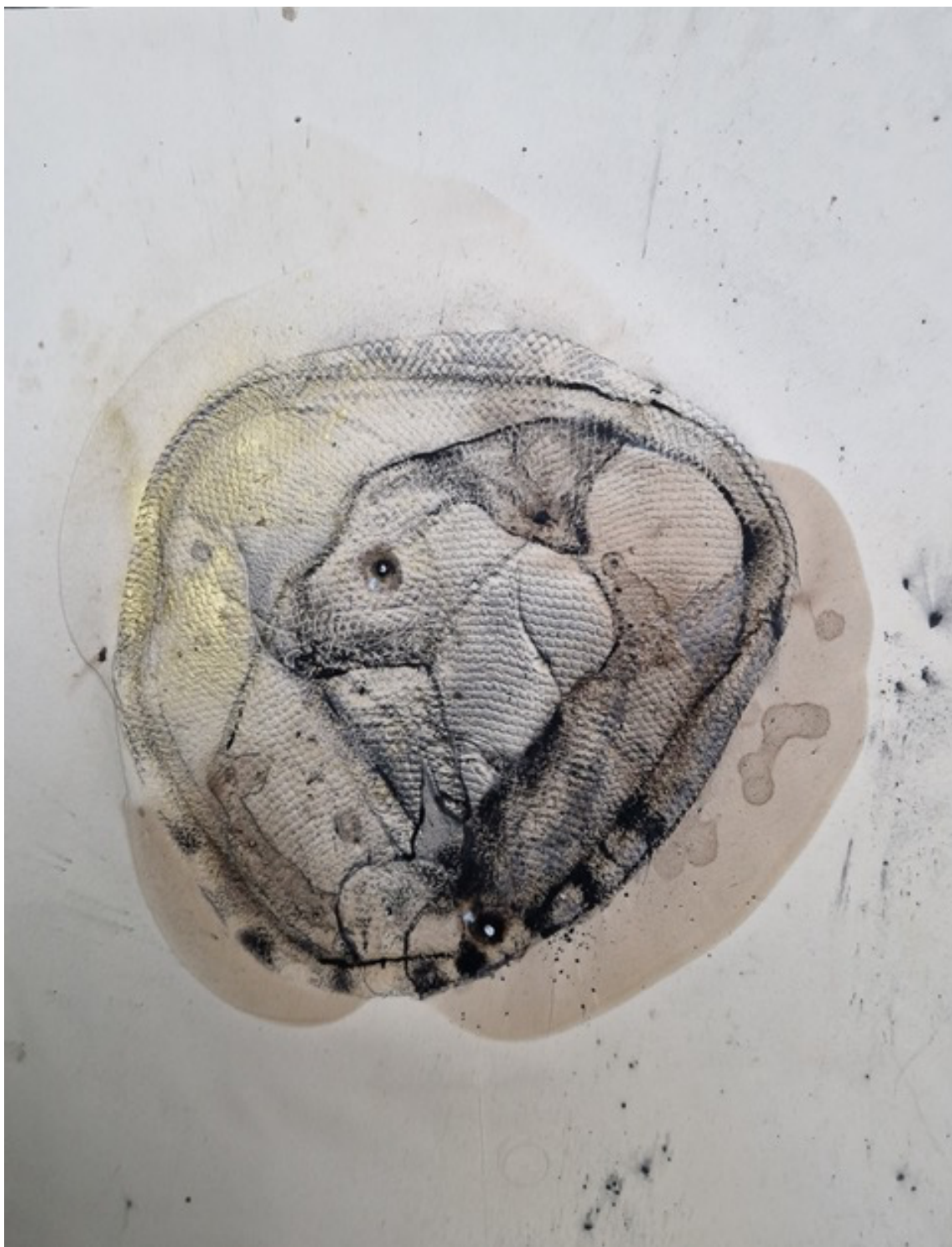
Lionel Sabatté Pêche , Février 2024 Monotype 1/2 Goudron de marée noire, huile et pigment sur papier, 65 x 53 cm

RELATIONS POUR LA PRESSE ET LES MÉDIAS FOUCHARD FILIPPI COMMUNICATIONS