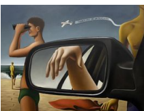
Justin Liam O'Brien Only One Way , 2024 Huile sur toile / Oil on canvas

Téléchargements / Downloads HD / HR BD / LR