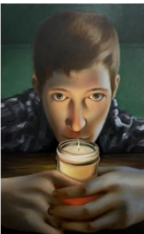
Justin Liam O'Brien Lighting , 2024 Huile sur toile / Oil on canvas

Téléchargements / Downloads HD / HR BD / LR