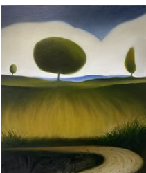
Justin Liam O'Brien Day , 2024 Huile sur toile / Oil on canvas

Téléchargements / Downloads HD / HR BD / LR