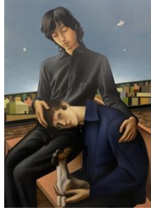
Justin Liam O'Brien In the Wind, 2024 Huile sur toile / Oil on canvas

Téléchargements / Downloads HD / HR BD / LR