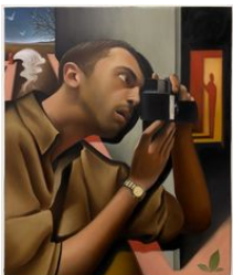
Justin Liam O'Brien Dark Room , 2024 Huile sur toile / Oil on canvas

Téléchargements / Downloads HD / HR BD / LR