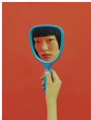
Nhu Xuan Hua, Chen (Portrait au miroir), 2024

Image numérique sur papier Hahnemühle white Rag, 205 × 99cm, édition. 1/3