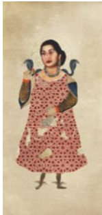
Nermine Hammam Warrior Woman (Oum Kalthoum), 2011

Image numérique sur papier Hahnemühle white Rag, 205 × 99cm, édition. 1/3