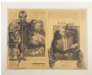
Adrian Piper, Vanilla Nightmares #15 , 1987,