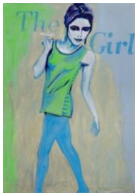
Elke Silvia Krystufek, The Girl , 1995

Impression jet d'encre sur papier titanium, 140× 105cm